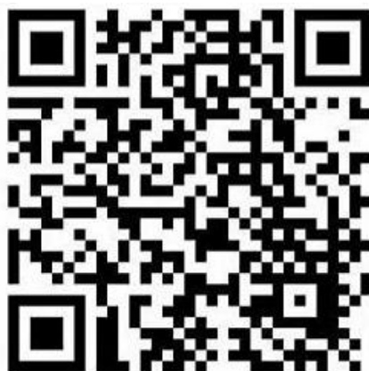
乌海市低保对象定期报告APP二维

温馨提示： 在享低保人员每月20日前通过手机移动端进行定期报告，对连续2个月未定期报告的予以停保，手机扫描以下二维码，下载乌海市低保对象定期报告APP。